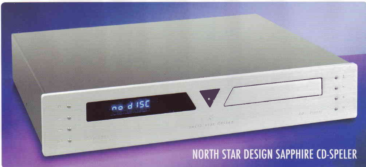
NORTH STAR DESIGN SAPPHIRE CD-SPELER