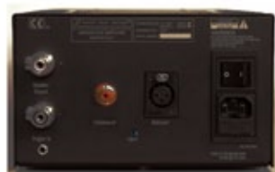
WBT and Neutrik input and output connectors.